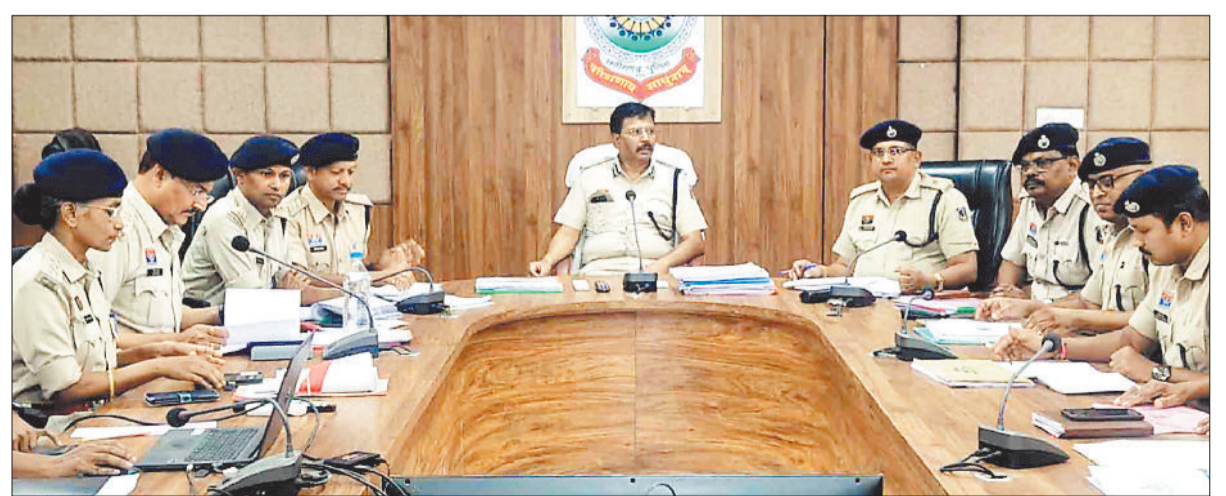
अधिकारियों से चर्चा करते एसएसपी।

फ्राड के पीड़ित को खुद के साथ घटित फ्राड की जानकारी को साझा करने हेतु प्रोत्साहित कर जागरूकता फैलाने, सड़क दुर्घटना के जोखिम को कम करने ब्लैक स्पॉट पर सुरक्षात्मक उपाए कराने, नियमित रूप से वाहन चेकिंग कर लापरवाहों पर सख्ती बरतने एवं नशीली दवाओं और मादक पदार्थों के व्यापार पर कड़ी कार्रवाई करने के निर्देश पुलिस अधिकारियों को दिए। एसएसपी ने लंबित अपराध एवं शिकायतों की समीक्षा कर निराकरण में तेजी लाने के निर्देश देते हुए थाना प्रभारियों से कहा कि आज का दौर तकनीक का है जो तकनीकी रूप से सक्षम होगा। अपराधों के कायमी के बाद समयसीमा 30-60-90 दिवस के भीतर अनिवार्य रूप से अभियोग पत्र न्यायालय में पेश करें। साइबर फ्राड के मामलों में गिरफ्तार आरोपियों की लिंकेज डिटेल जानकारी पोर्टल पर अनिवार्य रूप से अपलोड करने एवं साइबर फ्राड के शिकायत पर तत्काल एक्शन लेने के निर्देश दिए ताकि पीड़ित की आर्थिक क्षति को कम किया जा सके। इस दौरान अतिरिक्त