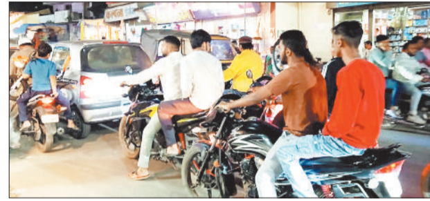
वाहनों की लगी भीड़