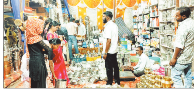
वर्तन दुकान में खरीदी करते लोग।

इस बार अक्टूबर के महीने में जीएसटी में छूट सरकार द्वारा दी गई, इसे लेकर भी व्यापारियों एवं उपभोक्ताओं में उत्साह भर गया था। यही कारण था कि धनतेरस के अवसर पर सहित ग्रामीण अंचल के लोगों के द्वारा विभिन्न जरूरत की सामग्रियों का जमकर खरीदी करते हुए धन वर्षा की। हालांकि खरीदी के लिए धनतेरस शुभ दिन होता है, लेकिन इसके पूर्व पुष्य नक्षत्र में ही लोगों के द्वारा विभिन्न सामग्रियों की खरीदी शुरू कर दिए थे और धनतेरस के दिन तो जमकर खरीदी किए। शहर में शनिवार के दिन गुमराता एकट के चलते व्यापारी अपनी दुकानें बंद रखते थे, लेकिन शनिवार के दिन ही