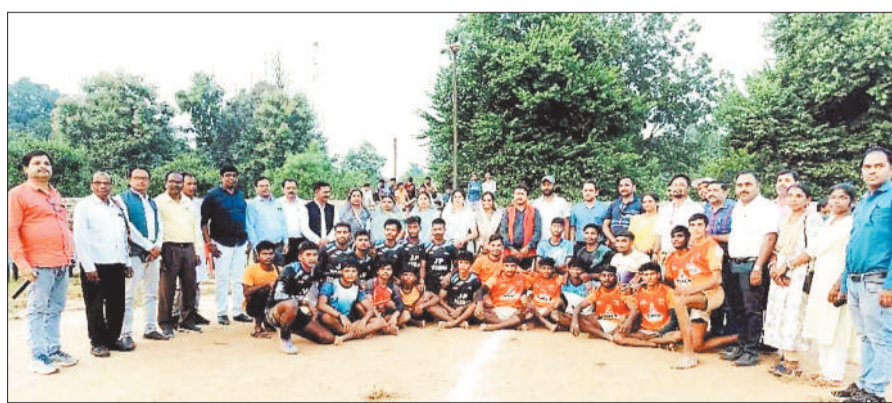
अतिथियों के साथ खिलाड़ी।

प्रतियोगिता में देवनगर की टीम ने बेहतरीन प्रदर्शन करते हुए कबड्डी के पुरुष और महिला दोनों वर्गों में जीत हासिल की, वहीं खो-खो में भी देवनगर की टीम ने अपना वर्चस्व कायम रखा। वॉलीबॉल प्रतियोगिता में रामानुजनगर की टीम