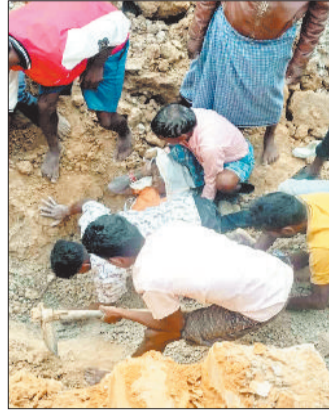
मिट्टी में दबी महिला, निकालते लोग।